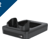
Lade und Datenübertragungscradle